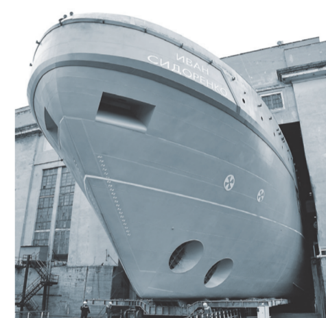
Дедвейт судна 4415 тонн, скорость — до 17 узлов в час.